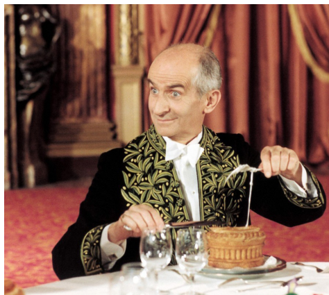
L'Aile ou la Cuisse, Claude Zidi

Charles Duchemin, le directeur d'un guide gastronomique qui vient d'être élu à l'Académie Française, se trouve un adversaire de taille en la personne de Jacques Tricatel, le PDG d'une chaîne de restaurants. Son fils Gérard anime en cachette une petite troupe de cirque.