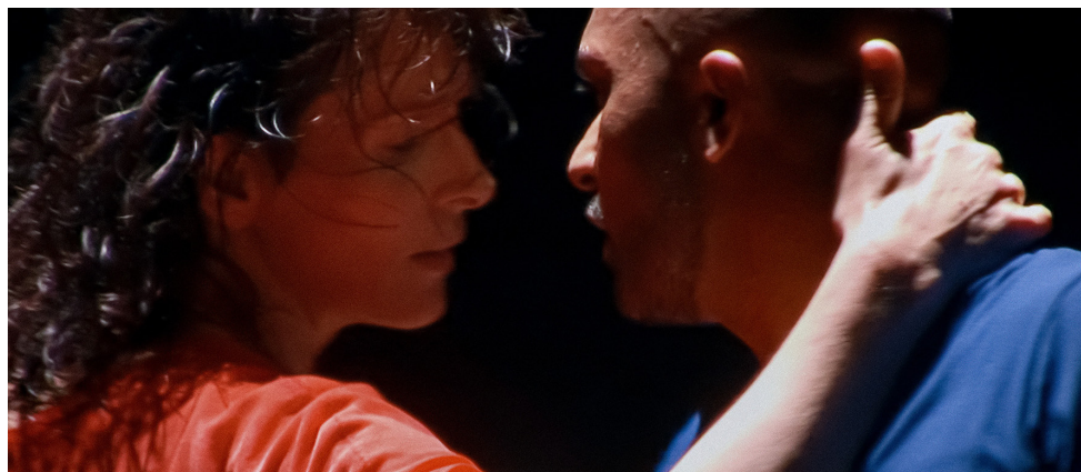
En nous, Juliette Binoche

Emporté par leur énergie punk, le poignant journal de guerre de deux jeunes Ukrainiennes engagées depuis quatre ans comme secouristes sur le front et amies à la vie, à la mort.