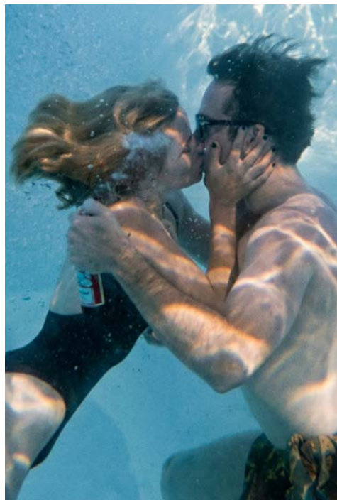
Leaving Las Vegas, Mike Figgis

Après avoir été licencié de la société de production où il travaillait, Ben, scénariste alcoolique, part pour Las Vegas avec l'intention de s'y perdre entièrement. Installé dans un hôtel miteux, à proximité des bars ouverts jour et nuit, il rencontre Sera, une prostituée dont il tombe amoureux. Elle l'accompagne dans sa déchéance, tandis qu'une relation intense et fragile se noue entre eux, au cœur des excès de la ville.