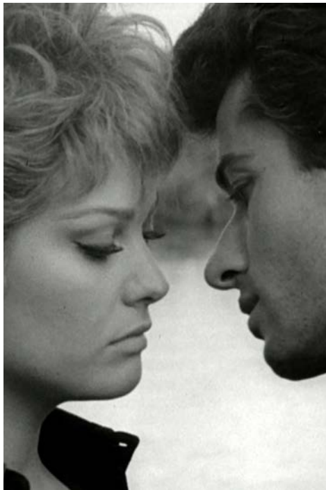
La Ragazza di Bube, Luigi Comencini

Hiroshima – 6 Août 1945. La vie suit son cours, comme tous les jours. Un terrible éclair déchire le ciel. Suivi d'un souffle terrifiant. Et l'Enfer se déchaîne. Des corps mutilés et fantomatiques se déplacent parmi les amas de ruines. Au même moment, Yasuko faisait route sur son bateau, vers la maison de son oncle. Une pluie noire s'est alors abattue sur les passagers. Ils ne savaient pas, ils ne savaient rien. Quelques années plus tard, les irradiés sont devenus des parias dans le Japon d'après-guerre.