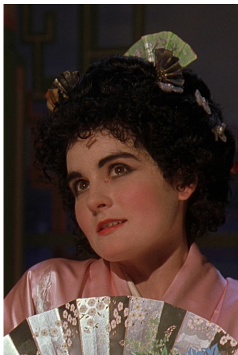
TOPSY TURVY, Mike Leigh

En 1880, Gilbert et Sullivan forment un tandem auquel tout réussit : ce sont les rois de l'opéra-comique. Mais le récent échec de Princesse Ida redistribue les cartes. Découragé, Sullivan souhaite se consacrer désormais à la musique dite sérieuse mais Gilbert et lui sont sous contrat avec le directeur du Savoy Theatre, Richard D'Oyly Carte. Ce dernier leur demande de lui présenter en urgence une nouvelle œuvre. C'est en visitant une exposition japonaise que Gilbert puise l'inspiration pour écrire le livret d'une nouvelle pièce. Ce sera Le Mikado .