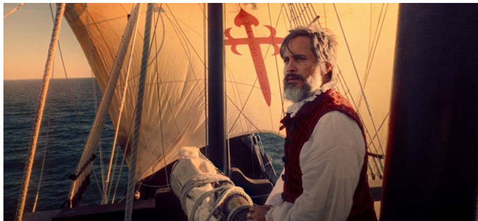
Magellan, Lav Diaz