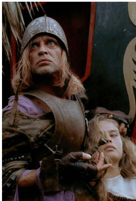
Aguirre, la colère de Dieu, Werner Herzog