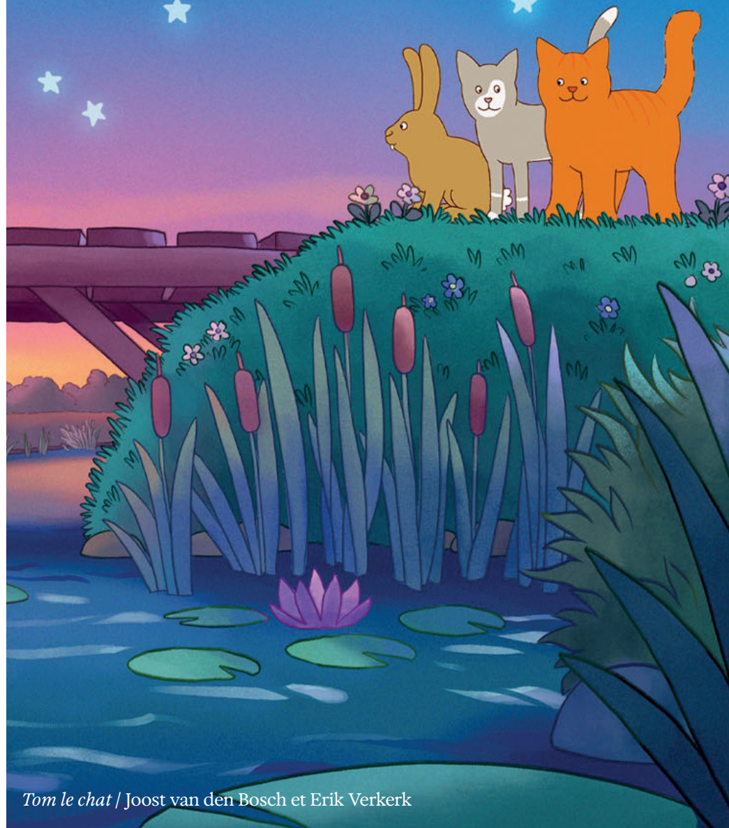
Tom le chat | Joost van den Bosch et Erik Verkerk