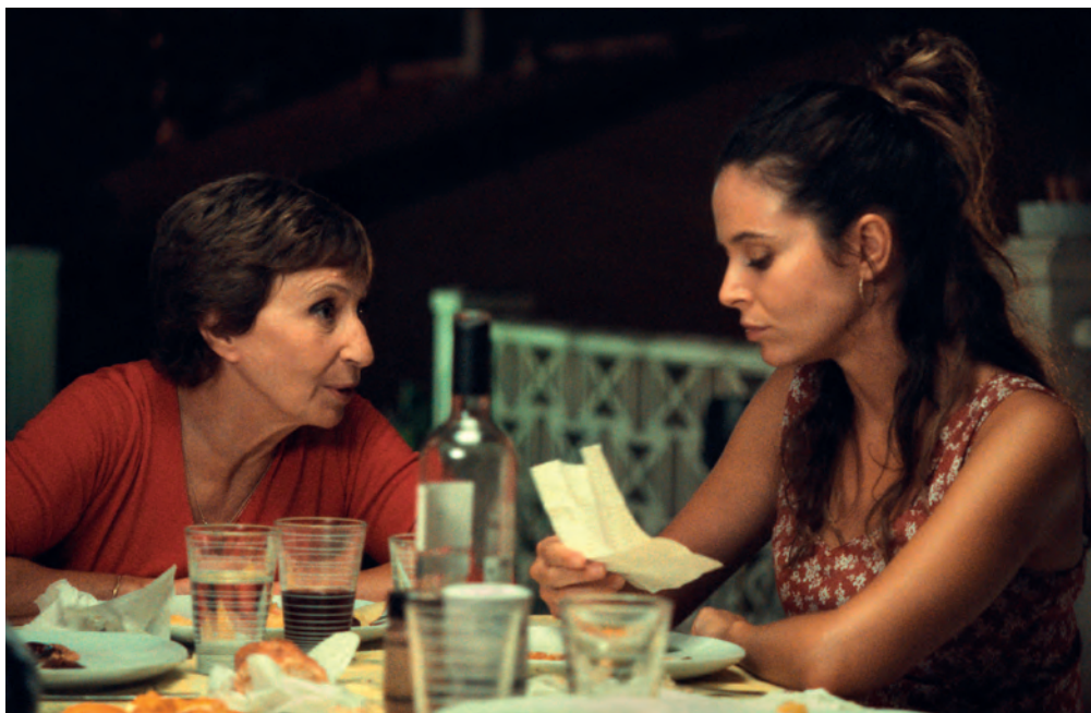
La Pie voleuse / Robert Guédiguian