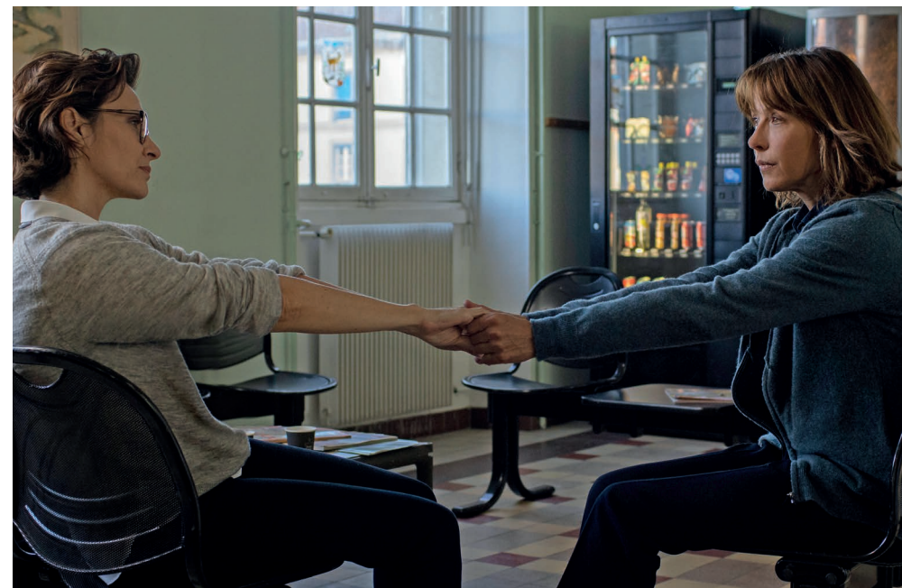
Tout s'est bien passé | François Ozon

Serre moi fort I Am Greta Première année Le Genou d'Ahed Il Varco La Voix d'Aïda