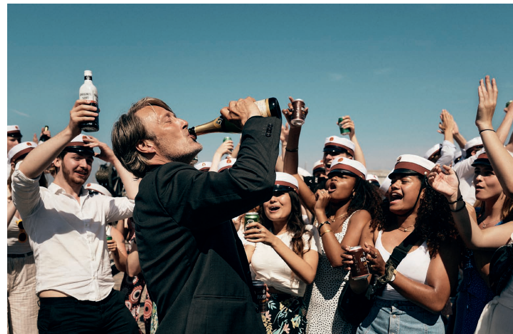
Drunk | Thomas Vinterberg

Calamity, une enfance de Martha Jane Cannary The Competition Les Équilibristes Chien Pourri, la vie à Paris La Chouette en toque Honeyland Josep Les Choses qu'on dit, les choses qu'on fait Maternal